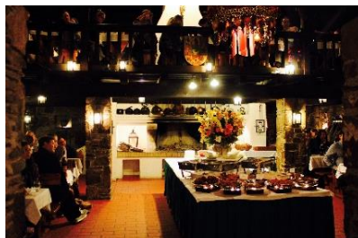
© Ariadne Neureiter / Iris Gundacker

Buschenschank Fuhrgassl-Huber Neustift am Walde 68 1190 Wien